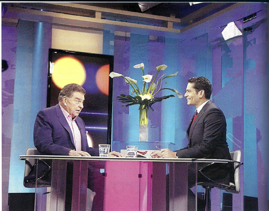
Ismael Cala, en su moderno set de CNN entrevistando a don Francisco, popular personaje de la televisión latinoamericana.

A los 25 años, Cala migró de El Caney hacia La Habana. Allí permaneció por tres años hasta que lo invitaron a animar un evento en Canadá. Cuenta que no sabía inglés, pero dijo que lo dominaba; entonces emprendió su primer viaje fuera del país. Se encontró con un mundo que solo había visto en películas y decidió quedarse. Trabajó como camare-